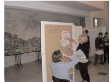
Die Stiftung HAK ist seit Jahren mitverantwortlich für die Organisation der Fachtagung der BAGW für Arbeitsanleiter, 2010 in Bergisch-Gladbach