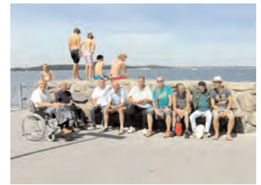
Strandausflug des Hauses Raboisen nach Kiel

Viel Zeit und Energie wurde auch in die Erstellung eines Qualitätshandbuches für das Haus Raboisen gesteckt. Dieses Handbuch wird in 2011 vorliegen, allerdings noch nicht mit einer Zertifizierung. Diese könnte aber auf der Basis des Handbuches später noch erfolgen.