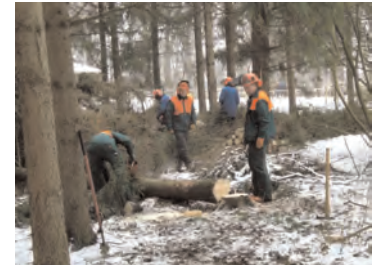
Lehrgang zum sicheren Umgang mit der Motorsäge für Maßnahmeteilnehmer nach SGB II und Heimbewohner

Das Jahr 2010 war für die stationäre Wohnungslosenhilfe wieder ein bewegtes Jahr. Es zeigte sich, dass die