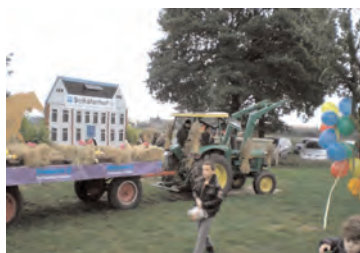
Ein Wagen des Schäferhofs – von der Stiftung und dem Kooperationspartner Lebenshilfe-werk geschmückt – war auch beim Erntedankumzug 2010 in Appen dabei.