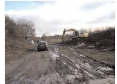
Die Arbeiten für die Beobachtungsstation am Appener See haben im