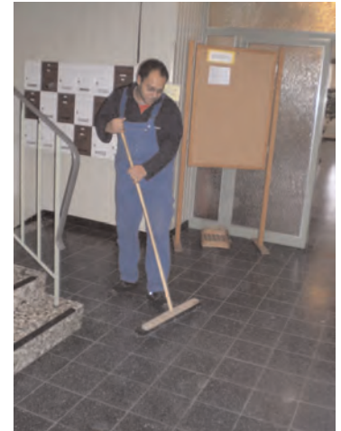
Die Bewohner sind in die Hausreinigung einbezogen.

In lebenspraktischer Hinsicht unterscheiden sich Ziele der Wohngruppe nicht wesentlich von denen des übrigen Heimbetriebes: gelernt werden soll die Einteilung/Umgang mit Geld (z. B. Einkaufspläne und Haushaltspläne erstellen auf ALG II-Niveau, prüfen von Angeboten, insbesondere bei Lebensmitteln), gemeinsames planen, einkaufen und zubereiten von Mahlzeiten inkl. erstellen eines persönlichen Rezeptbuches, organisieren der Hausreinigung, Unterstützung bei der Freizeitgestaltung, die nicht sehr kostenintensiv sein darf (gemeinsames Spielen, Ausflüge etc.), vorbereiten des Auszugs in eine eigene Wohnung durch Planung der Erstausrüstung.