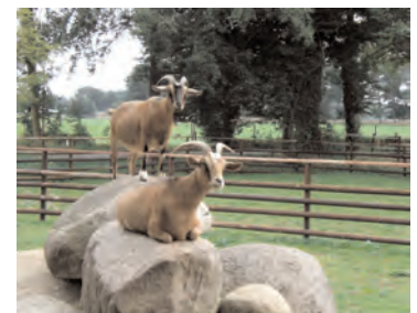
Der Streichelzoo wird gern besucht.