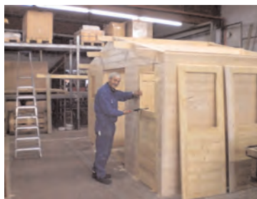
Jährlich verlassen mehrere Holzhäuser die Werkstatt Schäferhof.