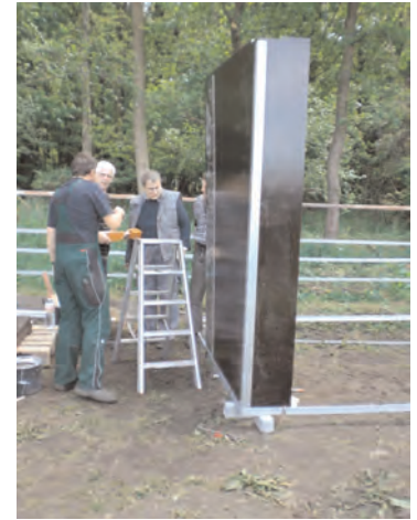
Bau von mobilen Weidehütten durch Maßnahmeteilnehmer