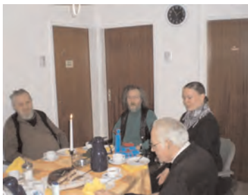
Geburtstagsfeier in der Kate