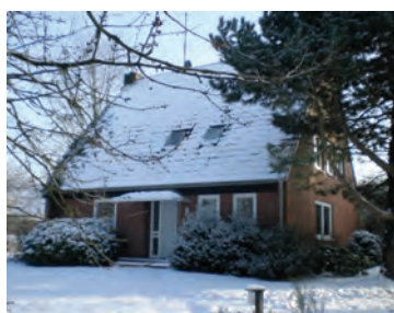
Winterstimmung am Haus Schäferhofweg 29

Wohnungslosenhilfe den Anspruch, zielorientierte befristete Hilfe zu leisten, voll erfüllt. Es gab 49 Aufnahmen und 49 Abgänge, ein Bewohner verstarb während des Aufenthaltes.