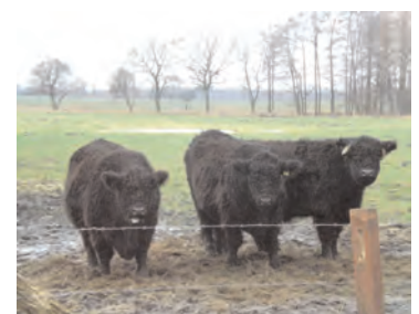
Rinder der Stiftung Naturschutz gehören zum Landschaftsbild des Schäferhofs.