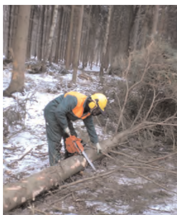
Arbeit am liegenden Holz