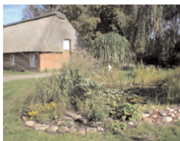
Blick auf die Kate