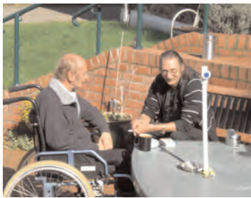
Die Terrasse vor dem Haus Raboisen lädt zum Verweilen ein.