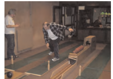
Der gemeinsame Kegelabend von Bewohnern und Mitarbeitern hat allen viel Spaß gemacht.