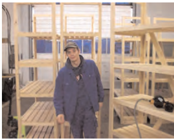
Blick in die Holzwerkstatt: Anfertigung von Transportregalen