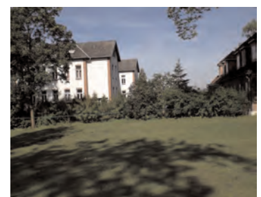
Haupthaus im Sommer