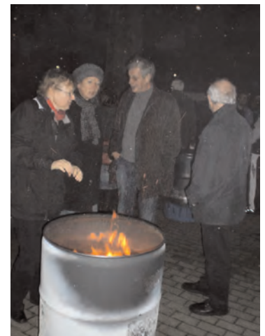
Impressionen vom „Abend der Diakonie“ in Pinneberg