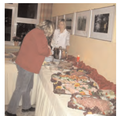
Die Weihnachtsfeier 2010 war geprägt durch Darbietungen von Bewohnern und Mitarbeiterinnen und Mitarbeitern der stationären Wohnungshilfe und des Hauses Raboisen. Ein schönes Büffet gehörte wie immer dazu.