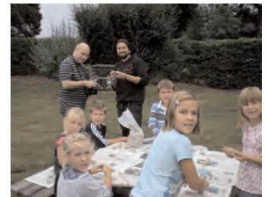
Ferienprogramm für Appener Kinder auf dem Schulhof: Ein Tag in der Steinzeit

Die Neuausrichtung der Landwirtschaft des Schäferhofes zur Erlebnislandwirtschaft mit Reitbetrieb, Naturerlebnis und anderen Naherholungsmöglichkeiten wurde im Berichtsjahr weiter vorangebracht. Das integrative Reitsportzentrum Gut Schäferhof konnte die Zahl der Plätze für Pensionspferde auf ca. 100 erhöhen. Betrachtet man alle Bereiche, auch Verpackung und Montage sowie den GaLa-Bau, dann sind seitens des Lebenshilfswerks am Standort Schäferhof Ende 2010 ca. 90 Beschäftigte eingesetzt. Das Miteinander