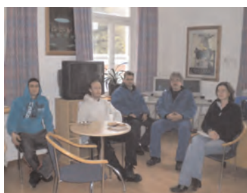
Die Bewohnerversammlung findet einmal monatlich statt. Verantwortlich für die Durchführung sind der Bewohnersprecher und eine Sozialpädagogin.