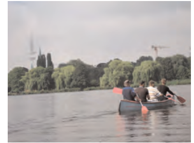
Gruppenfahrt auf der Alster: Auf zu neuen Ufern !