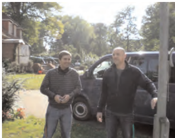
Gute Laune hilft bei der Arbeit der Erzieher.