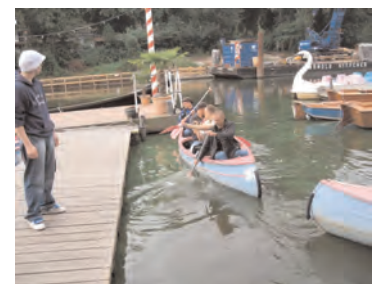
Mehrmals im Jahr finden Ausfahrten mit Bewohnern in kleinen Gruppen statt.