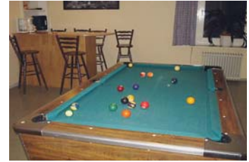
Im Nebenraum wird auch schon mal die eine oder andere Runde Pool oder Dart gespielt.

Wir auf dem Schäferhof versuchen auf vielfältige Weise, unseren Bewohnern Kontakt mit anderen Sozialwelten zu ermöglichen. Zu nennen sind hier die Ermunterung zu Selbstverpflegung, die zu Ein-