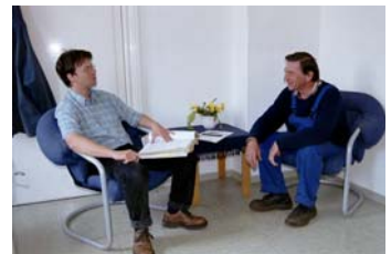
In ausführlichen Gesprächen mit unseren Klienten werden ganz individuelle Hilfepläne erstellt.