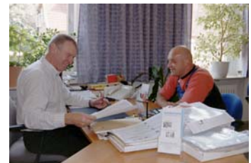
Die Hilfe bei der Schuldregulierung ist Teil der Unterstützungsarbeit des sozialen Dienstes.

Mit Ausnahme von zwei angeschobenen Verbraucherinsolvenzverfahren durch die öffentliche Schuldenberatung wurde auch 2004 eine umfassende Schuldenberatung vor Ort angeboten. Der Soziale Dienst und der Klient nehmen dabei Kontakt mit dem Gläubiger auf und stellen die individuelle