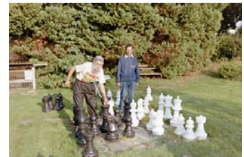
In der wärmeren Jahreszeit kann der Freizeitbereich der Aussenanlage genutzt werden.