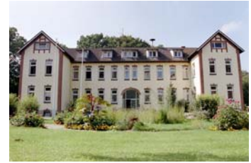
Der Schäferhof, ein Platz um sich neu zu orientieren und das weitere Leben vorzubereiten.

Anschließend werden auf der Grundlage der Jahresstatistik einzelne Aspekte der Jahresarbeit beleuchtet.