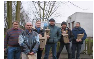
Teilnehmer des Projektes Hainholz übergeben dem NABU Nisthilfen. Maßnahmen für den Naturschutz haben in unseren Beschäftigungsprojekten einen hohen Stellenwert.

Die Arbeitsgelegenheiten sollen nach den Vorgaben des Gesetzes im öffentlichen Interesse liegen und zusätzlich zu Pflichtaufgaben des Staates sein. Wir wollen diese Vorgabe durch eine Konzentration auf Aufgaben des Naturschutzes und der Landschaftspflege erfüllen