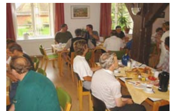
Das Geburtstagsfrühstück ist eine, bei Bewohnern und Mitarbeitern, beliebte Tradition geworden. Es wird auch von ehemaligen Bewohnern genutzt