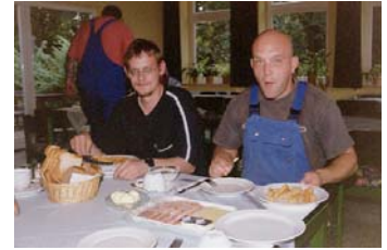
Unser Mittagstisch steht nicht nur unseren Bewohnern zur Verfügung, sondern wird auch von Mitarbeitern benachbarter Betriebe als Kantine genutzt.

Neben der Entwicklung dieses neuen Projektes haben wir unser Kerngeschäft, die stationäre Wohnungslosenhilfe, in mehreren Teamsitzungen analysiert, über unsere bestehende Konzeption nachgedacht und insbesondere die Schnittstellen zwischen den einzelnen Bereichen thematisiert. Dieser interne Austausch- und Beratungsprozess dauert an. Als Ergebnis ist eine Überarbeitung des noch gültigen Konzeptes von 1993 angestrebt.