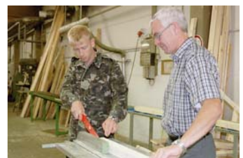
Unser integriertes Hilfeangebot umfasst auch Beschäftigungsmöglichkeiten, wie hier in der Holzwerkstatt