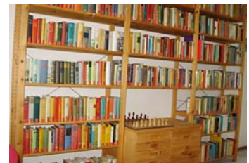
Der Leseraum ist für Bücherfreunde interessant. Er ist aber auch Treffpunkt für PC-Begeisterte, Brettspieler und Fernsehratten.

Mit geringem baulichem Aufwand wurden Lese- und PC-Raum mit dem Fernsehraum auf eine Weise miteinander verbunden, die völlig neue Nutzungsmöglichkeiten und ein neues Raumgefühl schafft. Plötzlich fand auf derselben Grundfläche noch ein Billardtisch Platz, der über ebay günstig ersteigert wurde, auch eine Dartscheibe konnte aufgehängt werden. Einige Kleinmöbel und eine kleine Musikanlage schafften eine gemütliche Atmosphäre. Für die Einrichtung konnten wir auf einige Privatspenden zurückgreifen.