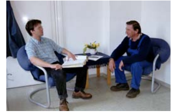
Eine entspannte Atmosphäre ist unerlässlich um ein echtes Vertrauensverhältnis aufzubauen.

Während die Öffnung des Geburtstagsfrühstücks und die Einladung zu Veranstaltungen schon eine gewisse Tradition besitzen, war das Ehemaligentreffen 2004 das erste seiner Art.